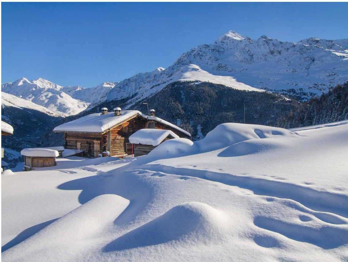
Baite di Plaghera

Il presente servizio ha esclusivamente finalità informativa. www.valtellinaoutdoor.it non assume alcuna responsabilità per eventuali danni legati alle attività escursionistiche ed allo stato dei percorsi. Si consiglia di consultare il Bollettino Meteo e Neve prima di ogni escursione.